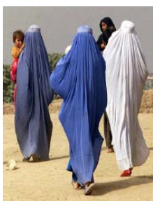
Donne afgane avvolte nei burqa